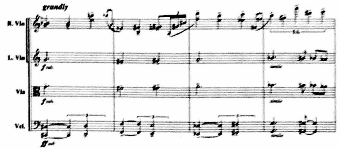
דוגמה 4: רן, רביעייה מס' 1, תיבות 89-92

את המוזיקה שנתחר כלתי-סתומים בפרק הראשון, הושמו-כצד כמהלך הפרק השני ונבחנו-מחדש מזוויות שונות בפרק השלישי.